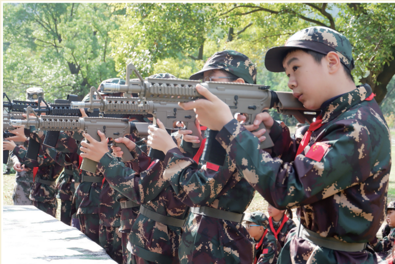
2024年11月5日,江溪小学第六届少年军校活动

(三)系统建构:实现“秋白精神”引领的江南燕德育课程具象化、结构化和系统化。 以“秋白精神”为价值内核,通过提炼“秋白精神”中的理想信念、责任担当等核心要素,将抽象德育理念转化为具象化的课程目标与活动方案,构建“理念引领-课程支撑-协同育人-整体发展”四位一体的实践路径,形成